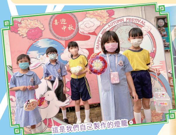
這是我們自己製作的燈籠。