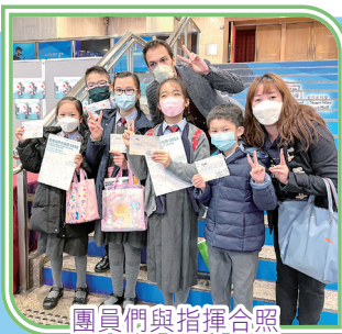
團員們與指揮合照

合唱團繼續參與香港校際合唱節(HKICF)。合唱節是深受學界歡迎的年度合唱盛事，當中包括合唱節大師班及比賽，比賽中，本校團員們的歌唱技巧得以提升，並於比賽中獲得銀獎！