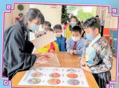
通過有趣的活動認識《西遊記》

透過不同的活動，如設計芭蕉扇、觀看火山爆發實驗、西遊記服裝同樂日等，讓學生從中認識中國文學文化，並從主角的行為學會勇敢、堅毅、面對困難不退縮等的精神。