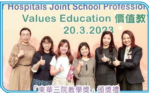
「東華三院教學獎」頒獎禮

本校一向着重發展學生多元智能，培養具音樂潛能的學生發展才能。弦樂小組參加「JSMA聯校音樂大賽2022」，在小學合奏（弦樂）中榮獲金獎。