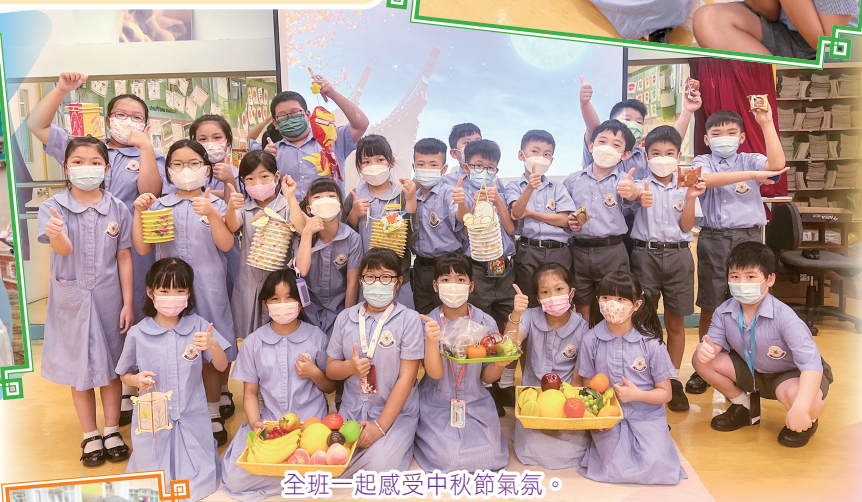
全班一起感受中秋節氣氛。