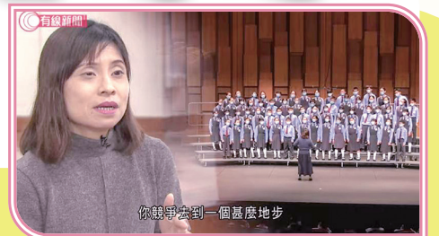
你競爭去到一個甚麼地步

合唱團參與了「香港校際合唱節」計劃，成績及表現優異，獲主辦機構邀請，接受有線電視新聞部採訪，到校拍攝合唱團練習情況，分享訓練時的喜悅與成就。