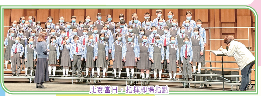
比賽當日，指揮即場指點