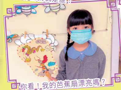
你看！我的芭蕉扇漂亮嗎？