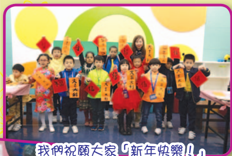
我們祝願大家「新年快樂！」