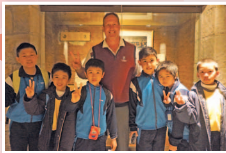
P4 students visited the Hong Kong Museum of History.