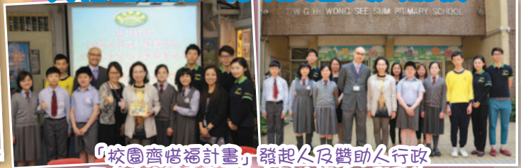
「校園齊惜福計畫」發起人及贊助人行政長官夫人梁唐青儀女士到校評估，與學生及老師交流環保心得。