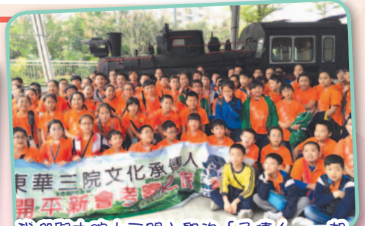
我們與本院十三間小學的「承傳人」一起參與考察活動，實為難得的機會。