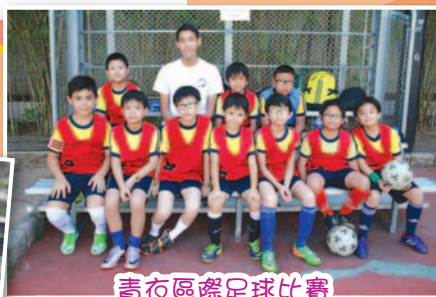
青衣區際足球比賽