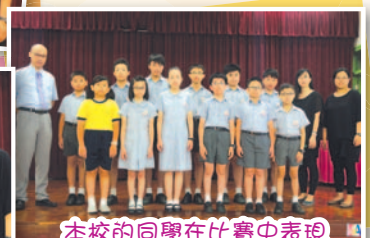
本校的同學在比賽中表現出色，勇奪多個獎項。