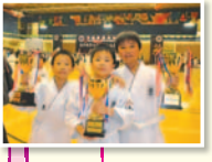
中國香港品勢總會舉辦之「亞洲城市小學品勢金杯賽」