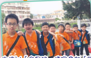
本校以「全男班」陣容參加「開平新會考察之旅」，獲益良多。

除此之外，兩日一夜的「開平新會考察之旅」更讓學生豐富生活體驗，提升他們高層次思維能力，如分析能力、批判能力、協作能力及運用資訊科技能力等。