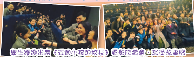
學生獲邀出席《五個小孩的校長》電影欣賞會，深受故事感動，亦有幸能與電影中的女主角楊千嬅小姐作分享。