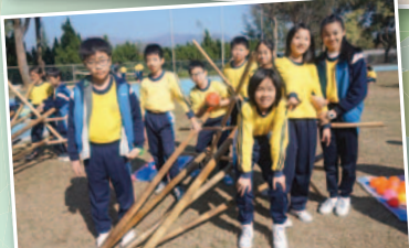
六年級同學參與畢業營，同創美好的回憶。