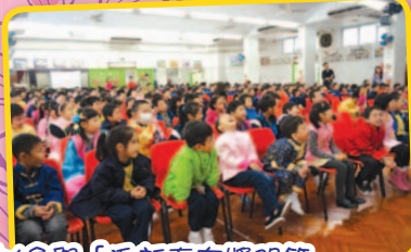
在嘉年華會中，同學既可以參與「迎新春有獎問答遊戲」，又可高唱賀年歌曲，場面樂也融融。