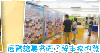
展覽讓嘉賓更了解本校的發展。