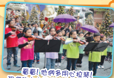
看看！他們多用心拉琴！我們的小提琴家正投入演出。我們獲得了掌聲。