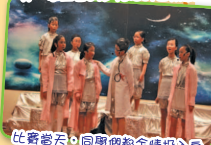
比賽當天，同學們都全情投入自己的角色中。