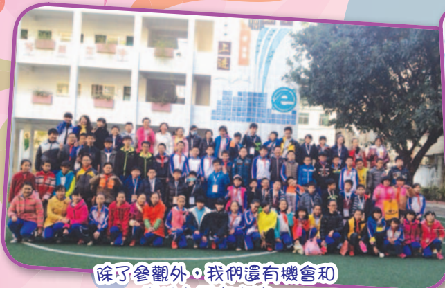
除了參觀外，我們還有機會和當地小朋友交流。