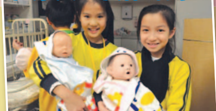
健康兵團參與香港理工大學「健康兵團伙伴計劃」，學習健康的知識。