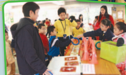
透過「賀年食品寓意大追蹤」、「新年習俗對對碰」、「新春年花大賞」等攤位遊戲，加深了我們對新春習俗的認識。