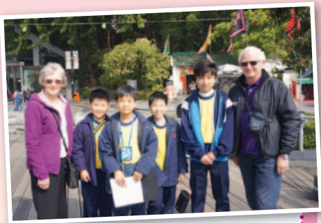
A group of P5 boys had a friendly and nice chat with a couple from Canada.