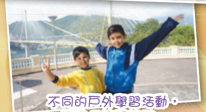
不同的戶外學習活動，讓我們擴展視野。