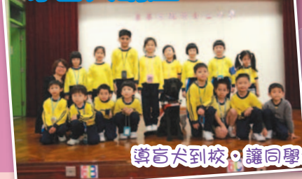
導盲犬到校，讓同學們體會失明人士的生活。