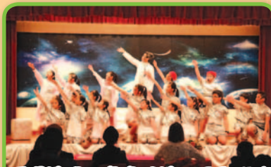
透過演唱、角色扮演，同學們的自信心大大提高。

自2013年起，本校參與由香港藝術學院推行的「香港學校戲劇節」，讓學生有更大的空間訓練音樂及戲劇表演的技能。藉着英語音樂劇訓練，發展學生的共通能力及培養正確的價值觀及態度，更大大提升學生英語說話的能力。今屆香港學校戲劇節，本校喜獲傑出舞台效果獎、傑出合作獎、傑出整體獎及三名傑出演員獎。