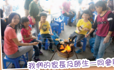
我們的家長及師生一同參與親子旅行，共度美好的時光。