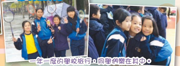
一年一度的學校旅行，同學們樂在其中。