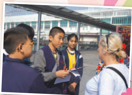
A group of P6 students interviewed tourists at the Star Ferry Pier.