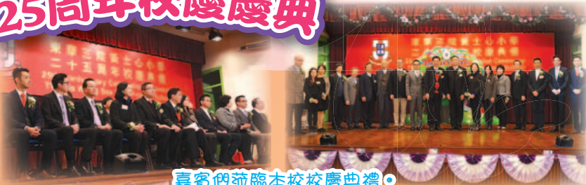
嘉賓們蒞臨本校校慶典禮。

本校紮根青衣已二十五年，為了慶賀創校銀禧紀念，本校舉辦多項慶祝活動，包括：「25周年校慶慶典」、「校慶同樂日」、「校慶開放日」及「校友盆菜宴」。