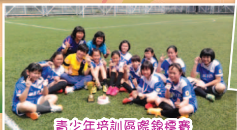
青少年培訓區際錦標賽