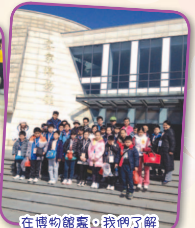
在博物館裏，我們了解客家人的生活文化。