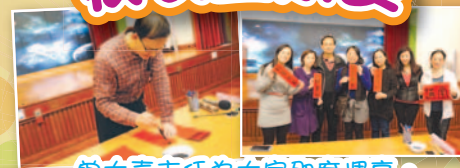
曾大書主任為大家即席揮毫。