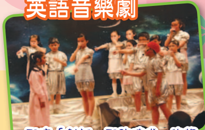
緊接「創新、緊貼時代」的趨勢，學生嘗試多元化的音樂劇。