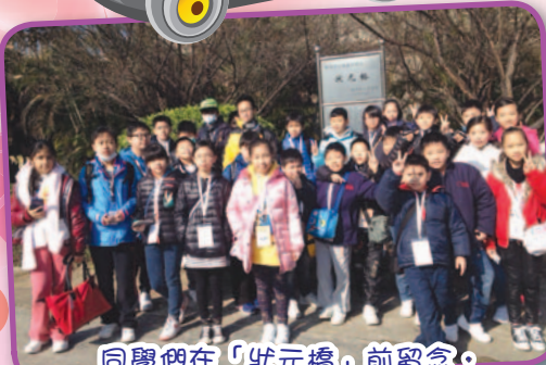
同學們在「狀元橋」前留念，希望學業進步。

「同根同心：香港初中及高小學生內地交流計劃（2014）」之梅州之旅目的為學生提供交流經驗，開拓他們的視野，認識客家圍龍屋的歷史背景和建築特色，並比較梅州和香港的客家建築及現存的客家傳統風俗。