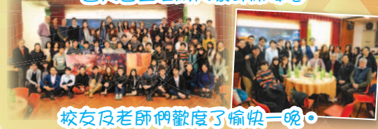
校友及老師們歡度了愉快一晚。