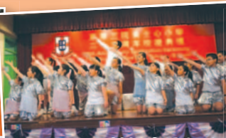
英語音樂劇的同學為我們演繹以關愛為主題的音樂劇。