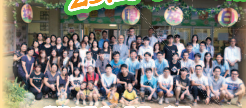
慶祝活動後，教師、家長、校友及義工們合照留念。