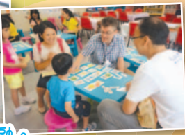
攤位遊戲讓大家樂也融融。