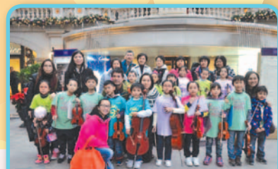
演出成功！大家開心心地合照。