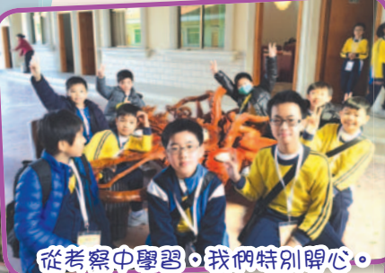
從考察中學習，我們特別開心。