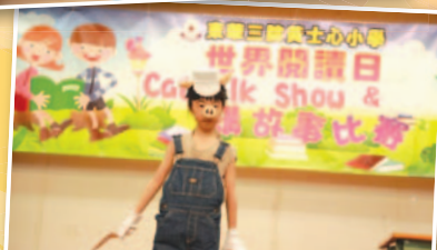
世界閱讀日當天，同學們扮演故事中的角色人物，維肖維妙。