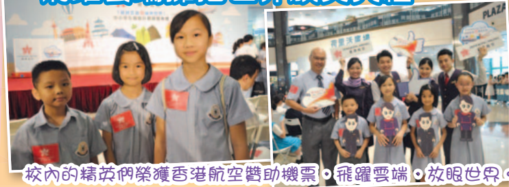
校內的精英們榮獲香港航空贊助機票，飛躍雲端，放眼世界。