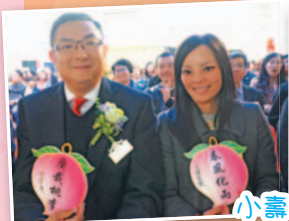
小壽桃上的語句祝願我院校譽昌隆。