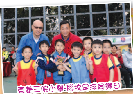
東華三院小學：聯校足球同樂日