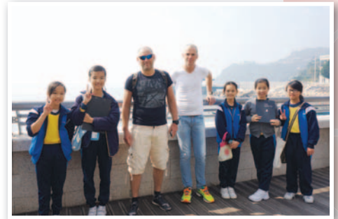
A group of P5 girls were very excited because the expats praised them for their good English.

Based on comments and opinions from teachers and students, life-wide learning is a precious learning experience for students. One of the graduates told us his most valuable experience in primary school was the life-wide learning activity. 'I was so scared when I invited the first tourist to have the interview,' he said. However, when he finished the interview, he felt so satisfied and found himself full of confidence in speaking English. Throughout the learning process, students are incentivized towards learning. They became self-regulated and self-confident. In addition, they learned communication skills, cooperative skills, problem solving skills and developed life-long learning capabilities. To conclude, life-wide learning is worth continuing to enrich our students' learning experience.