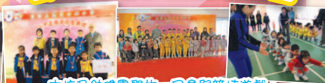
本校及幼稚園學生一同參與競技遊戲。