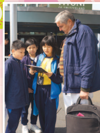
A group of P6 students took the interview seriously.