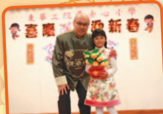
同學們都悉心打扮，爭奪「我最喜歡的新春造型大獎」。

本校於二零一五年二月十三日（星期五）舉行「喜慶『羊羊』迎新春—主題學習日」迎接中國農曆新年的來臨。學校安排了不同類型的活動，如攤位遊戲、製作賀年吊飾、寫揮春、新春故事大追蹤、品嚐湯圓、猜燈謎、問答遊戲、好書推介等，與學生一同迎接「羊年」的來臨。這些活動不但為當天倍添新春喜慶的氣氛，還加強學生對中國農曆新年習俗的認識。