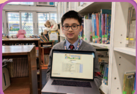
推薦學生報讀資優教育學苑課程