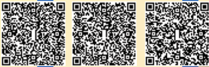
北京姊妹學校交流團相片集