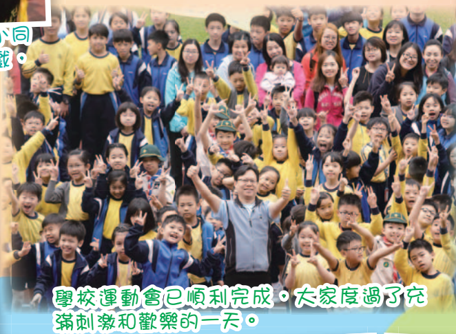
學校運動會已順利完成，大家度過了充滿刺激和歡樂的一天。