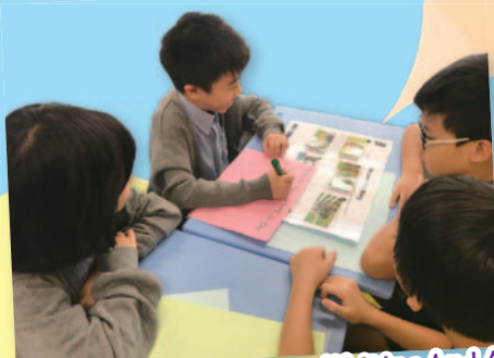
English Gifted Classes --- Writing And Acting