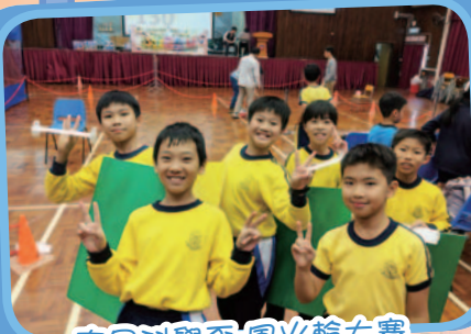
南昌科學盃-風火輪大賽