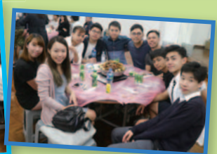
校友會和學校合辦的30周年校慶重聚日