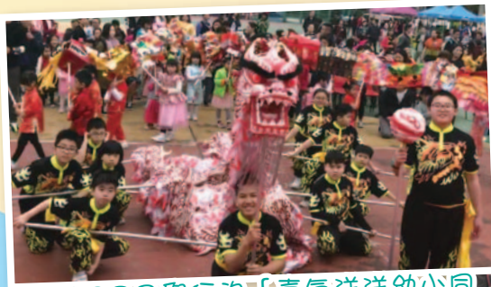
2月28日舉行的「喜氣洋洋幼小同樂慶新春」，透過表演及攤位遊戲，認識中國文化及農曆新年習俗。