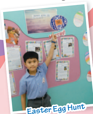
Easter Egg Hunt