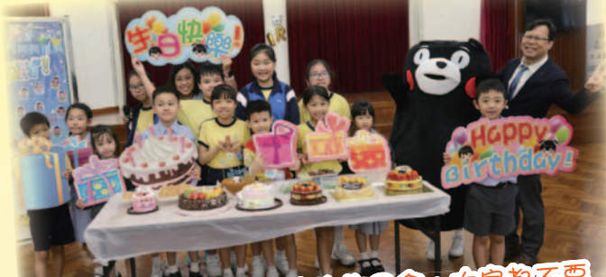
同學都十分享受學校的生日會，大家都不會忘記，在生日那天感謝父母把你們帶到這個世界喇！