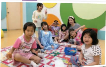
Pajama Reading Days