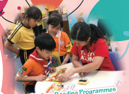
Break Time Reading Programmes

Our English teachers will continue to provide innovative teaching and learning practice to the highest standard.