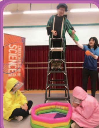
裘槎基金會科學巡迴實驗