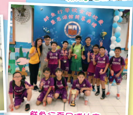
鮮魚行盃足球比賽