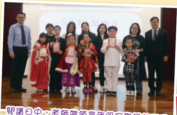
閱讀日中，老師帶領高年級同學設計不同的攤位讓同學透過遊戲中學習，還安排了中國歷史人物模仿比賽。