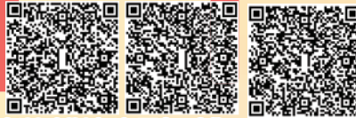
澳洲珀斯交流團相片集