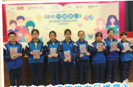
恭喜這8位同學的作品獲選入《少年：悅讀書心》的新書內，成為新的小作家，享受寫作的樂趣。