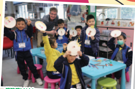
PRPLW Lessons --- Reading Activity