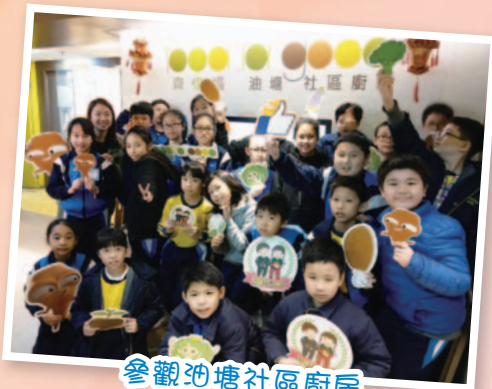
參觀油塘社區廚房