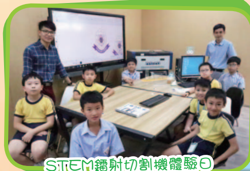
STEM鐳射切割機體驗日