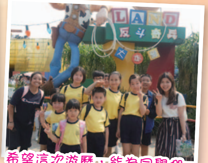
希望這次遊歷，能為同學們帶來童話般的愉快經歷。