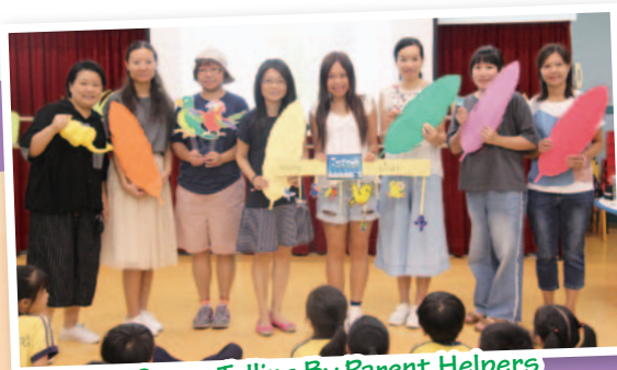
Story Telling By Parent Helpers