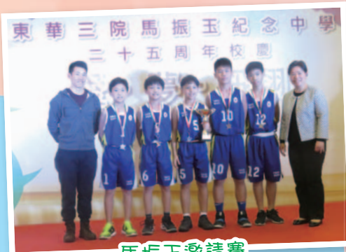
馬振玉邀請賽 (籃球及乒乓球)