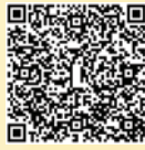
家教會 親子旅行相片集

感恩家教會各委員為大家舉辦親子旅遊，讓家長、學生和老師一起到大自然無拘無束旅遊。看著當天的照片，彷彿笑聲還在耳邊。