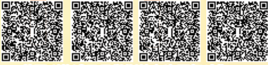
英國利物浦及曼徹斯特交流團相片集