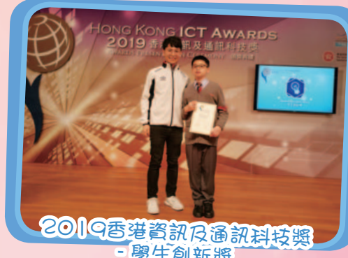
2019香港資訊及通訊科技獎 - 學生創新獎

學生以校方的gmail 帳號開啟google classroom 進行預習、自評、互評及課後延伸各種學習活動，提升學習效能。另外，各科組已把電子學習元素融入課堂內，提升學生的學習興趣，讓學習更富趣味。