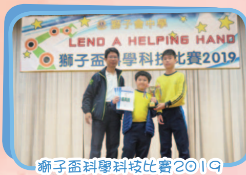
獅子盃科學科技比賽2019