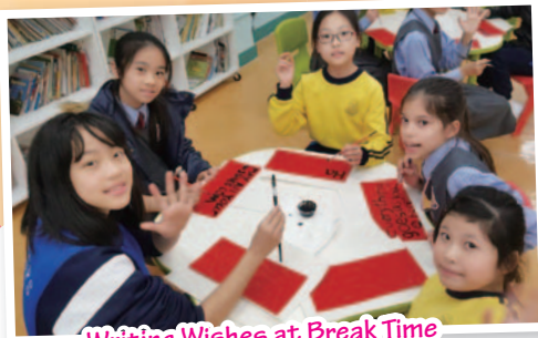
Writing Wishes at Break Time