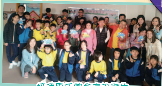
接待唐氏綜合症的學生