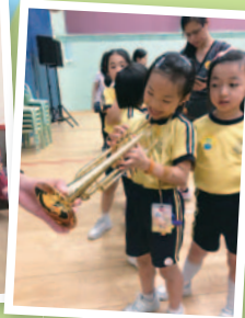
暑假就應該讓學生有不同的體驗。看到同學們的笑臉，就知道他們多喜歡音樂。