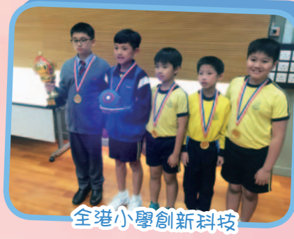
全港小學創新科技