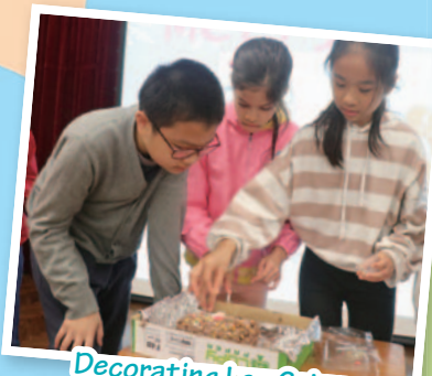
Decorating Log Cakes