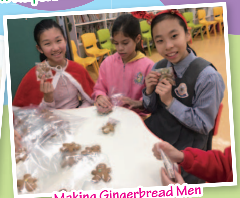
Making Gingerbread Men