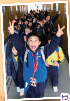
戶外學習參觀活動

本校著重推行德、智、體、群、美的全人教育，讓學生透過參與不同緊扣課程的學習活動，建立愉快學習氣氛，發展學生多元化潛能。