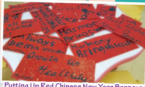
Putting Up Red Chinese New Year Banners

- Various tasks and activities in support of the celebrations of different festivals. Our students were able to see how to craft the pumpkin lanterns and the food westerners would have during Halloween. Students were also able to decorate their Christmas cakes and experience how to design the looks of their gingerbread men with our activities. It was also fun to see students writing their English lucky sentences using the traditional Chinese paint brushes at Chinese New Year and so on;