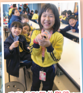
同學們到戶外學習，學懂一起珍惜這美麗的地球。