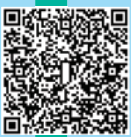
「有品足球大使」計劃新加坡文化交流團相片集