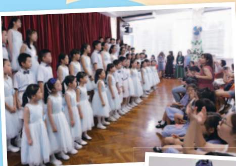
一年一度的「綜藝薈萃展才華」順利完結，同學們都把自己的功力發揮得淋漓盡致。