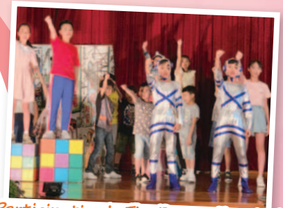
Participating In The Drama Festival