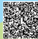
四川歷史文化及生態探索之旅相片集