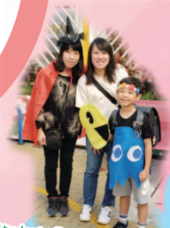
Students Dressed In Costumes