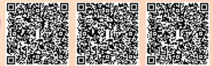
2019優秀學生台北遊學團相片集