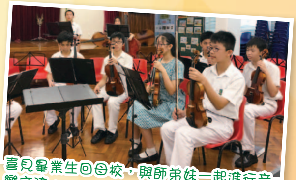
喜見畢業生回母校，與師弟妹一起進行音樂交流。 感謝荃灣官立中學的校長和老師，讓他們的學生到臨本校，與本校的弦樂團一起演出，進行這場美妙的中小學交流音樂會。