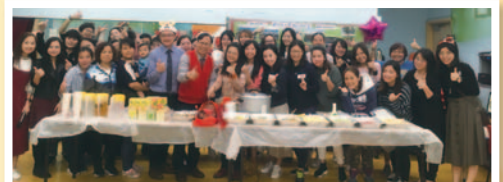
在普天同慶的日子裏，家長和老師一起聯歡，共建和諧校園。

感恩家教會各委員為大家舉辦親子旅遊，讓家長、學生和老師一起到大自然無拘無束旅遊。看著當天的照片，彷彿笑聲還在耳邊。