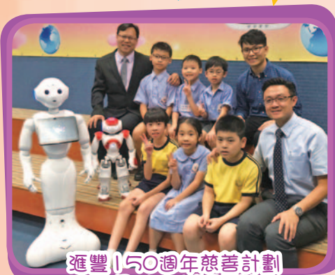
滙豐150週年慈善計劃 - Robot4SEN