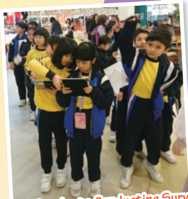
P3 Students Conducting Surveys