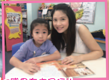
家長是學校的重要伙伴，感恩有你同行！