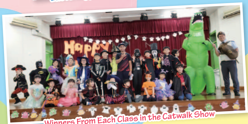
Winners From Each Class in the Catwalk Show