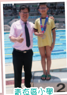
青衣區小學 校際游泳比賽