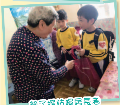
親子探訪獨居長者