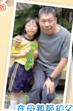
在目親節和父親節舉辦的活動，目的除了讓學生學會孝順，還鼓勵同學們向親人表達愛意。