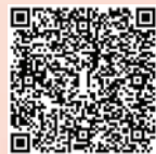
30周年校慶 典禮花絮