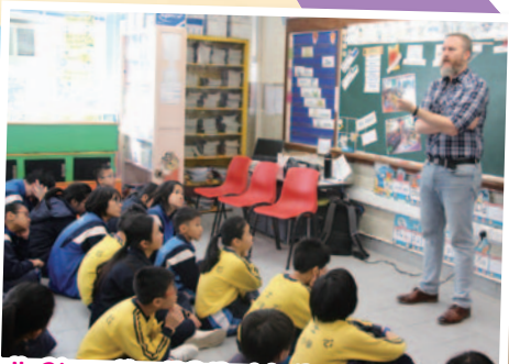
Talk Show For P6 By Mr Bruwell (TV Star)