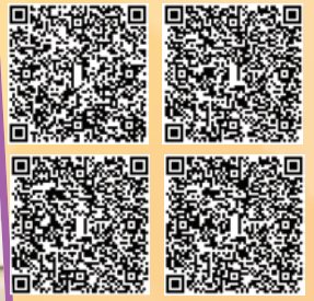
韓國STEM遊學團相片集