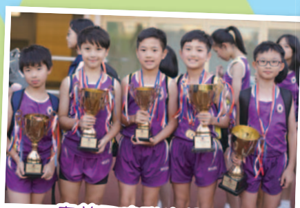
東華三院聯校運動會