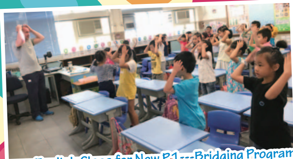
Summer English Class for New P1 --- Bridging Programme