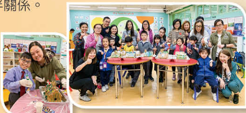
舉辦「GINGERBREAD HOUSE 親子設計活動」，讓家長和孩子們有一次愉快的體驗。

家長教師會已步入第二十屆。2019 年 11 月 8 日，本校舉行了第二十屆執行委員會就職典禮暨會員大會，新任執行委員會在各位家長會員的見證下就職。本校家長教師會得到校內各持分者的大力支持和認同，家長義工隊的義工人數不斷增加，成為家長與學校之間的一道橋樑，彼此建立了良好的伙伴關係。