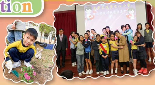
推動「環保」、「健康」及「生命」教育，培養學生良好的態度和習慣，協助學生擁有正向身心。

本 校學生的核心價值為關愛他人，包括：服務、展現正確的行為表現、尊重及愛護他人。自 2018 年開始，學校進一步營造校園正向文化，以加深教師、家長及學生對「正向教育」的認識，培養「正向」的人生態度。學校同時推動正向教育，建立正向校園文化，發揮學生品格優點，培養學生感恩之心及抗逆力，積極培養「正向」的人生態度，展開豐盛人生。