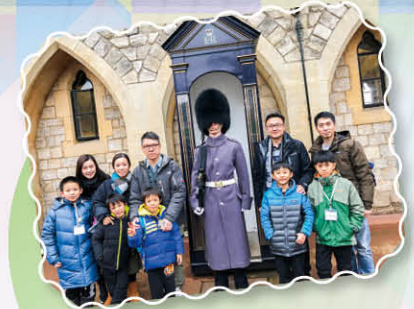
Windsor Castle – a place for Queen Elizabeth to spend her weekends.

Throughout this trip, students learnt about the culture of England and had more opportunities to speak English. They have gained more knowledge and interest in SOCCER. It was the most memorable Christmas and we will never forget all the joy and laughter we shared.