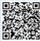
Link to Facebook page