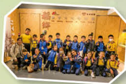
三年級 稻鄉飲食文化博物館