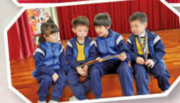
圖書共讀大使計劃