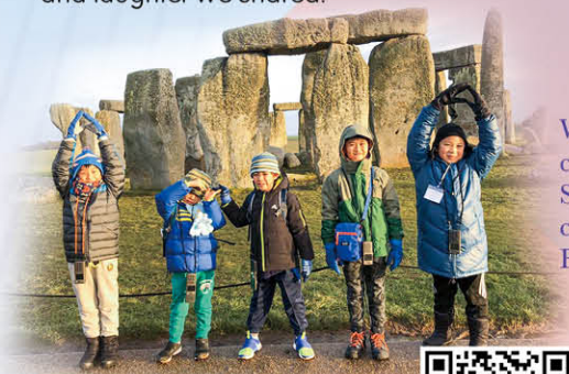
We visited the British cultural icon – Amesbury Stonehenge which was constructed from 3000 BC to 2000 BC.