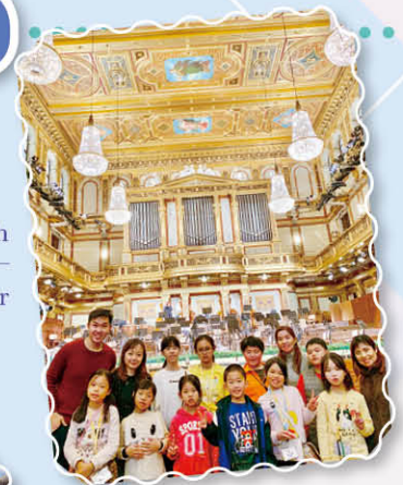
Our first time to see such a magnificent palace — Goldener Saal Wiener Musikvereins.