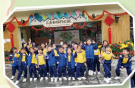
一年級 動植物公園