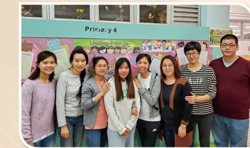
第二十屆家教會家長委員