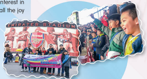
We are honoured to watch the Premier League, Arsenal vs Chelsea, at Emirates Stadium.