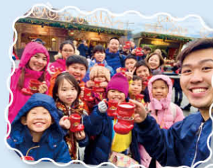
Say "Cheese" with our warm raspberry cinnamon sturm in Weihnachtsmarkt!