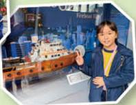
二年級 葛量洪滅火輪