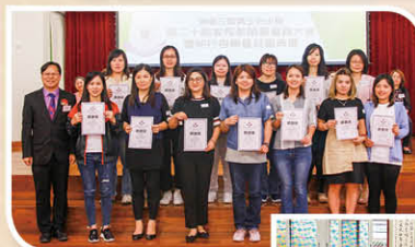
家長們積極參與學校各個大小活動，是學校的重要伙伴，感恩孩子們有你們陪伴。