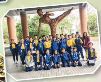
六年級 文化博物館