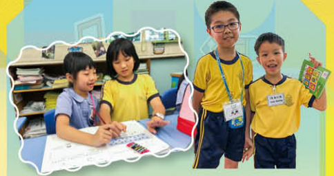
學生學習 24 個品格強項，以建立自信心，培養積極樂觀的正向態度，更幫助學生了解自己的性格強項，培養接受及欣賞自己的態度。