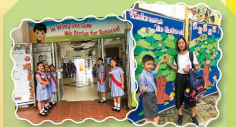
在校園各處張貼與正向教育相關的金句與名人事蹟，在校園和課堂營造正向欣賞的環境，凝聚正向的校園氣氛，增加師生的幸福快樂感。