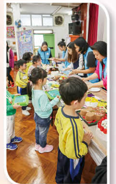
家長義工協助舉辦每月「學生生日會」，希望學生們擁有一個難忘的生日會。