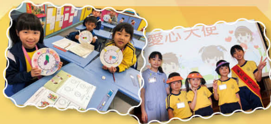
將正向滲入日常課堂及校園生活中。各科組利用不同平台，如周會、全方位課及班主任課等活動，宣揚及培養學生正向、感恩、欣賞的態度。