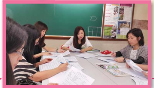
our principle, English teachers and the EDB officer are having a co-planning meeting.

We value the curriculum development in English Language Education. This year we worked closely with the language support officer of the Language Learning Support Section. The school-based support services helped to strengthen the holistic planning of the school-based curriculum. We developed a balanced and coherent school-based curriculum with horizontal coherence and vertical progression. Besides, we also explored some effective learning and teaching strategies to cater for learner diversity. To enhance Assessment Literacy, we used evidence to diagnose students' strengths and weaknesses so as to inform learning and teaching practices, and promoted effective use of assessment to foster self-directed learning.