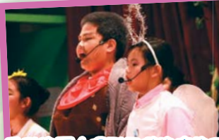
自私的巨人得到天使的接納和寬恕後，他可以再次和小孩子分享歡樂！