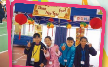
不同科組的攤位各顯心思，讓學生從不同角度認識農曆新年。