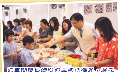
家長與學校經常保持密切溝通，攜手帶領孩子健康快樂地成長。