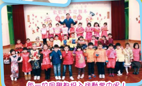
每一位同學都投入活動當中呢！