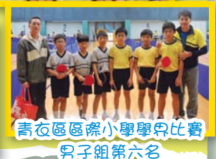
青衣區區際小學學界比賽男子組第六名