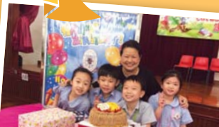
「生日會」是每個學生最愛的活動之一。中秋、新年、復活節、聖誕等的慶祝活動使師生間、同學間的愛互相流傳。