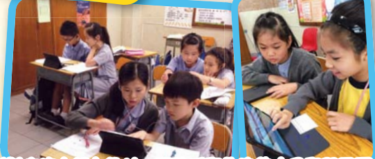
各科製作校本網上教材，更貼近學生的能力及學習需要。

電子學習的定位不是在「電子」，而是在「學習」，期望以電子學習來提升學生的學習興趣及自學的能力。由偏重於以老師主導，轉變為以學生和能力主導，照顧學生不同的學習需要，從而促進學與教的效能。