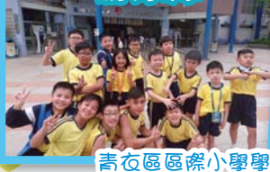
青衣區區際小學學界比賽