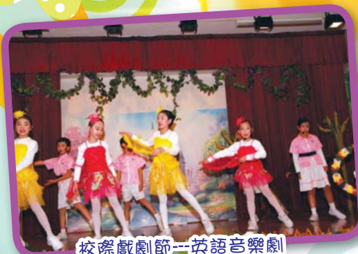
校際戲劇節—英語音樂劇

推薦資優生參加由教育局資優教育組或大專院校提供的資優課程，為學生提供富挑戰性的校外增潤及延伸學習機會，並鼓勵學生參加各種類型的校外比賽，讓學生一展所長，拓闊視野。