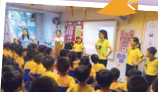
為把關愛推展到社區，學生更有機會到幼稚園教導小朋友護脊操。