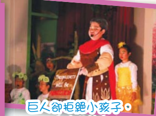
巨人卻拒絕小孩子，不准他們前來！