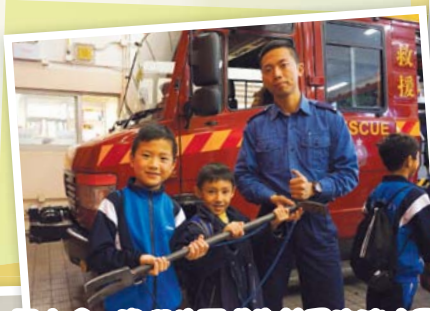
長大後，我們也要成為英勇的消防員。