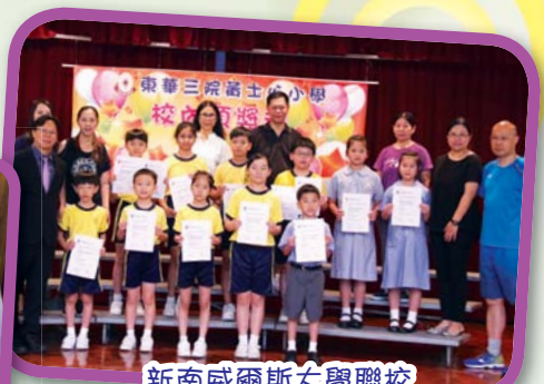
新南威爾斯大學聯校 學科評估