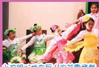
小孩開心地在巨人的花園嬉戲

回顧過往這五年的發展，開展初期，確實舉步維艱，所謂萬事起頭難。雖然老師面對不少難題，但是獲得校內老師的協助及家長的支持下，學生除了用流利的英語去演繹精彩的對白，嚴格的訓練既鍛煉他們守規則和堅毅精神，更藉着音樂劇的內容陶造良好的品格。因此，歷年各種音樂活動中，英語音樂劇是最受歡迎的項目之一。