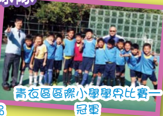
青衣區區際小學學界比賽一冠軍