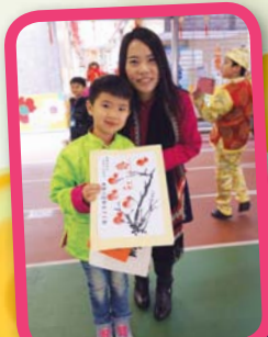
這個小手真真美，我也很喜歡呢！