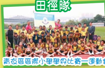
青衣區區際小學學界比賽一運動會