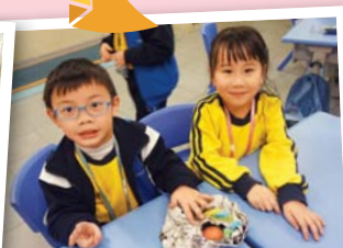
透過「護蛋行動」讓學生學會珍惜生命，從而學習如何關愛。