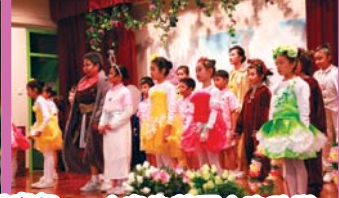
大家為着巨人的改變，重得歡欣快樂的生活！