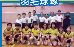
青衣區區際小學學界比賽一男子組個人賽第三名