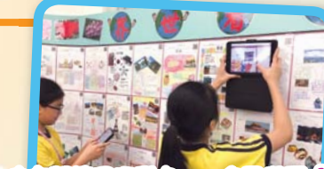
中文閱讀月活動之一：全民投票「我最喜愛的海報設計」。看！同學多踴躍利用資訊科技來投票！