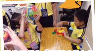
學校不僅有「關愛扶幼小先鋒」、「小老師」等計劃培養學生在不同方面關愛同學，亦設「玩具大使」教導同學與人相處的技巧。