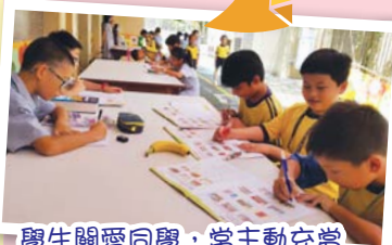
學生關愛同學，常主動充當小老師教導同學做功課。