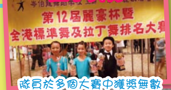
隊員於多個大賽中獲獎無數