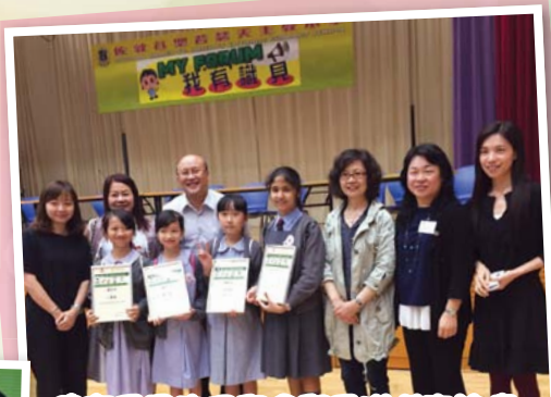
健康兵團的同學參與香港傑青論壇。