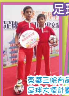
東華三院有品足球大使計劃