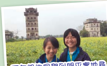
五年級的同學到睇平實地尋找東華三院歷史的足跡。