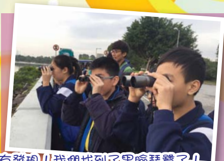
有發現!! 我們找到了黑臉琵鷺了!