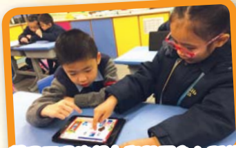
運用不同的網上學習平台內所鋪墊的學習任務，從預習到自學，從課堂學習至延伸活動，都促進了學與教的效能。

本校各科透過多媒體、遊戲或其他軟件、電腦程式等進行電子學習。在師生、生生的互動中，不但增加了學生的學習興趣，而且能鞏固所學，更作延伸活動。