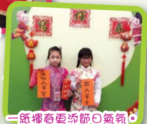
一紙揮春更添節日氣氛。