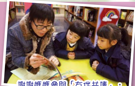
謝謝媽媽參與「友伴共讀」，讓我和好友共享閱讀樂趣。