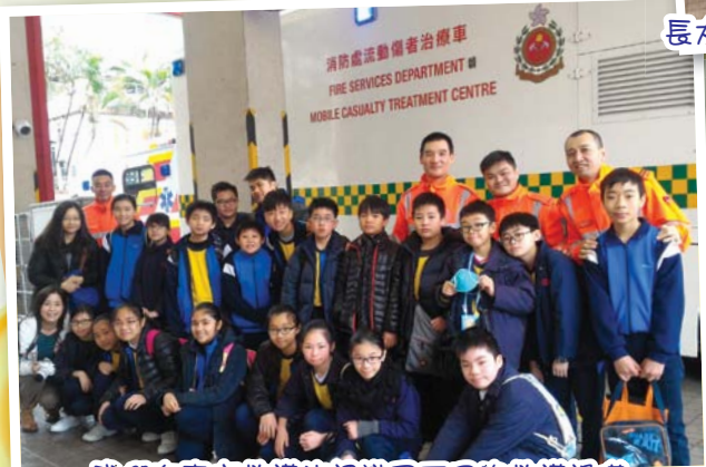
我們在青衣救護站認識了不同的救護設備。