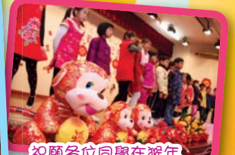
祝願各位同學在猴年像我一樣活潑聰敏。