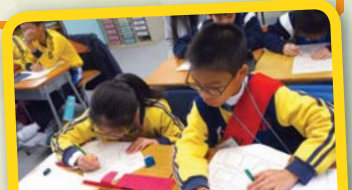
透過資訊科技設計教學軟件，將抽象的數學概念具體地呈現眼前呢！