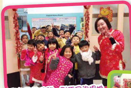
同學都整裝待發，到不同的場地認識農曆新年的傳統文化。