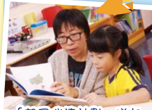
「親子伴讀計劃」增加了互表關懷的機會，促進親子關係。