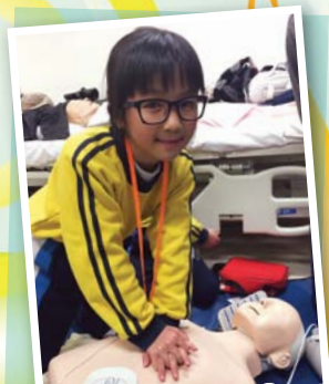
參加香港理工大學的「健康兵團伙伴計劃」後，我會把健康的知識推廣給大家。