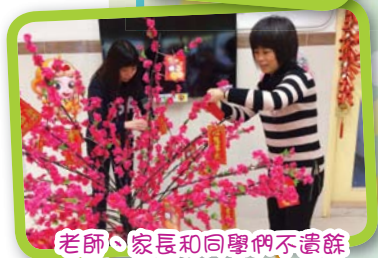
老師、家長和同學們不遺餘力地參與場地布置。