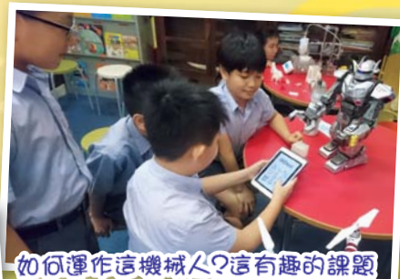
如何運作這機械人？這有趣的課題啟發學生了對科學探究的興趣。