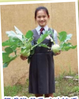
經過我們悉心地栽種，終於有收成了。