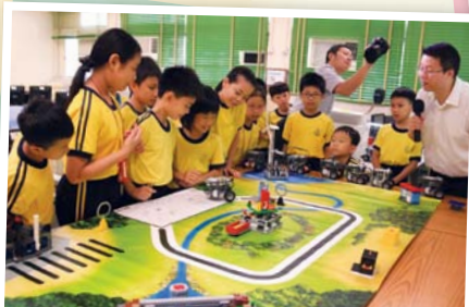
我們要盡快輸入程式，讓這輛由我控制的模型車在最短的時間內到達終點！