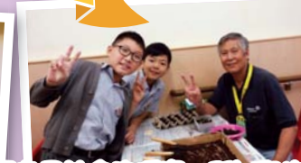
長者是社會的瑰寶，所以學校常組織活動給學生有送暖的機會，如把自家種植的蔬菜送到長者中心、開設工作坊教「老友記」種植技巧等，藉此聯表關愛。