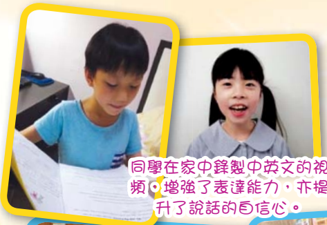
同學在家中錄製中英文的視頻，增強了表達能力，亦提升了說話的自信心。