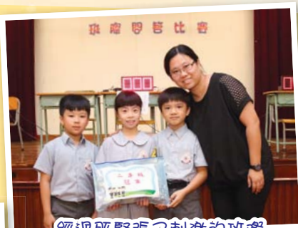
經過既緊張又刺激的班際問答比賽，我們勝出了。