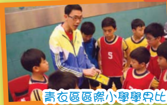
青衣區區際小學學界比賽一男子組季軍