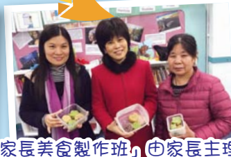
「家長美食製作班」由家長主理，除給予家長一展所長的平台，收到充滿「愛」的製成品更添快樂。