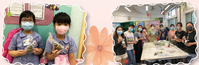
家長義工親手製作粽子鼓勵學生

感謝家長委員們的一股熱情，帶領一眾家長義工齊齊包迷你粽子。家長們特意以愛心，用心地製作了數百隻粽子為學生們打打氣，盼望同學們享受美味的粽子迎接端午節。