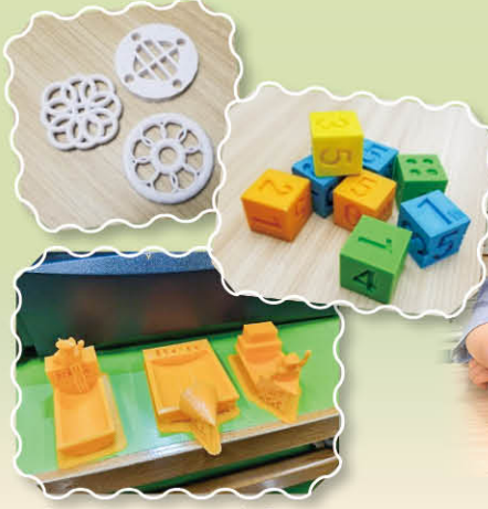
同學們的 3D 打印作品