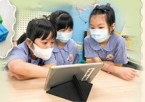
低年級同學運用平板電腦進行課堂活動