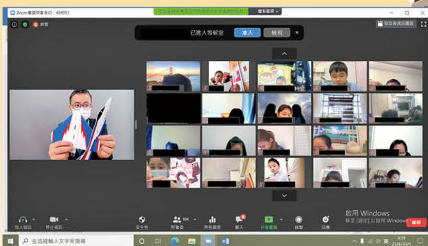
縱然疫情持續，STEM 課堂也不受阻