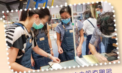
老師在教師工作坊中認真學習