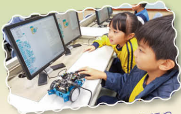
同學們年紀小小已在學習編程

本年度在常識、電腦及數學科課程中加入 STEM 元素，並因應課題進行跨學專題活動，全面培養學生動手解難、實踐創意的 STEM 精神。