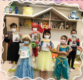
書中主角 CATWALK SHOW