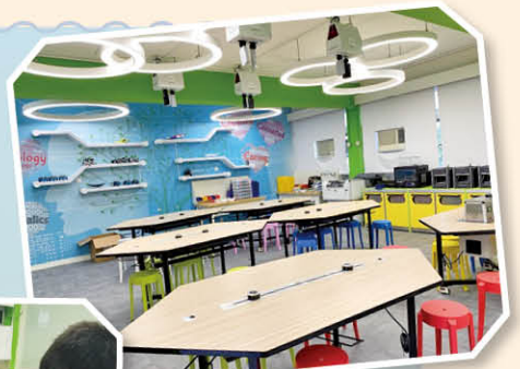
STEM Maker Lab 設備完善