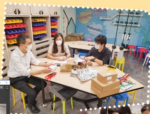
老師在認真地商討，籌劃 STEM 活動。

本校參加東華三院張明添中學的「小小科藝創建師」計劃，藉著教師工作坊、示範課堂、到校支援、備課會議、分享會等，裝備教師作 STEM 教學。