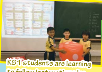
KS1 students are learning to follow instructions by playing this board game with this huge dice!