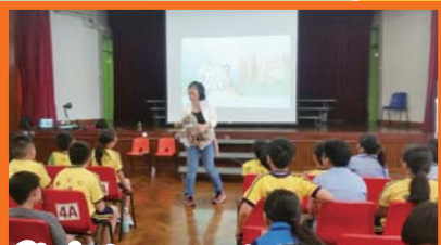
Students are meeting an author to learn how to write and produce a book.