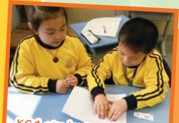
KS1 students are sorting words in pairs.