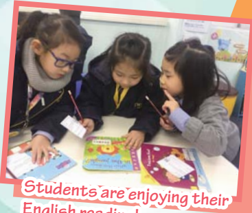
Students are enjoying their English reading!