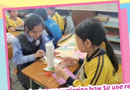
KS2 students are exploring how to use recycled materials to produce something new.

Our systematic English curriculum framework and programme has made English learning really fun and easy for our students! Students acquire knowledge and develop literacy skills during lesson time. Our English programme develops students' language skills through developmentally appropriate games, activities and e-learning with a focus on skill building and cultivating a love of English in our students. Their language development is then supported outside class by the language-rich environment at school and diversified extra-curricular activities such as choral speaking, English sports and musical. English learning is further reinforced at home by home reading, independent online learning and home-school cooperation. Students are immersed in an environment where they can build confidence and fluency in communicating in English.