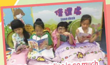
Pyjama reading is so much fun! We all love reading!