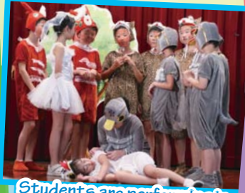
Students are performing in a musical with confidence.