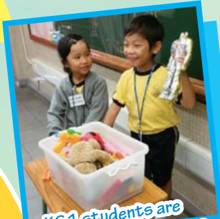
KS1 students are presenting their toys during show and tell.