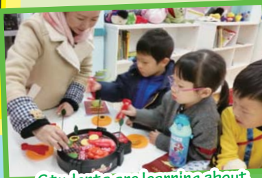
Students are learning about Christmas around the world!