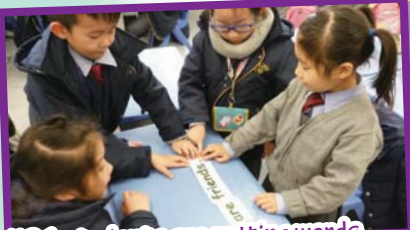
KS1 students are putting words together to make sentences in groups.