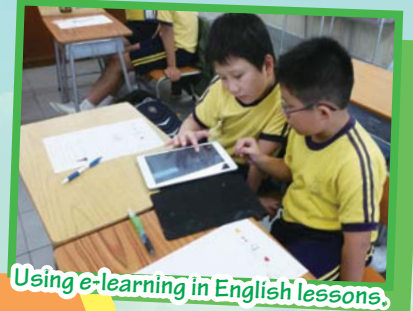
Using e-learning in English lessons.