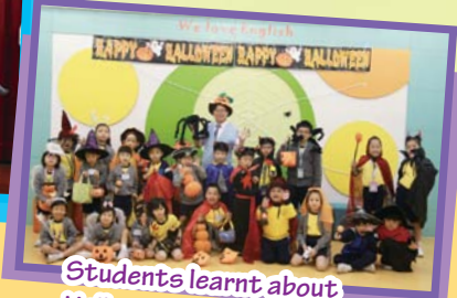
Students learnt about Halloween and are having so much fun dressing up!